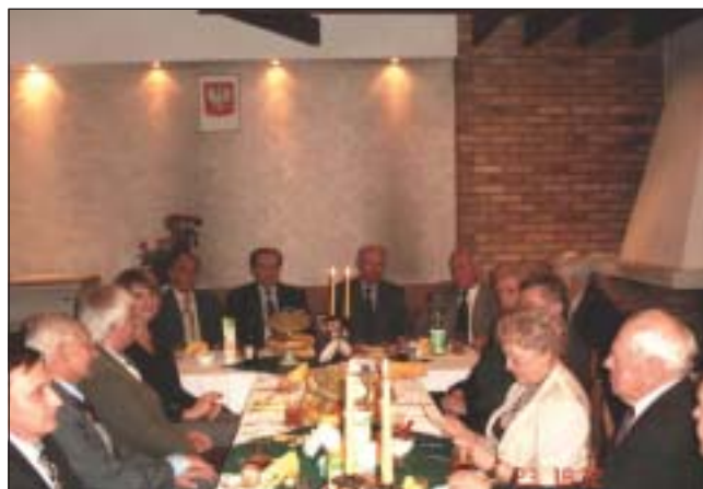
Grupa Uczestników dorocznego Spotkania prezydentów O/Kr SEP i O/NH SEP w Nowej Hucie (23.11.2006r.)