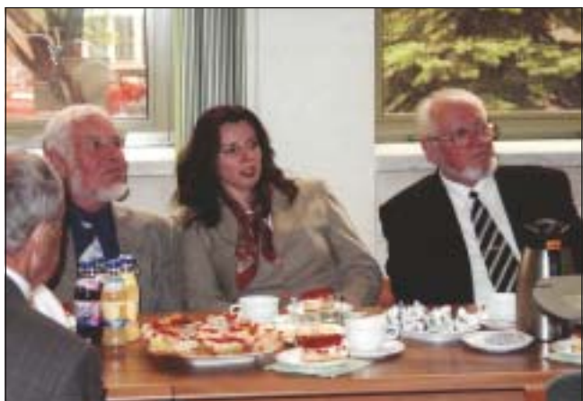
Goście z Egeru wraz z tłumaczką z zainteresowaniem śledzą wydarzenia w trakcie Uroczystego Spotkania z okazji MDE'2006 w ZEn Kraków (01-03.06.2006r.)