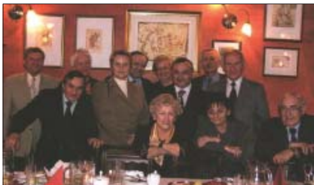
Uczestnicy dorocznego Spotkania Prezydentów O/ZW i O/Kr SEP w Restauracji w Katowicach (13.04.2007r.)