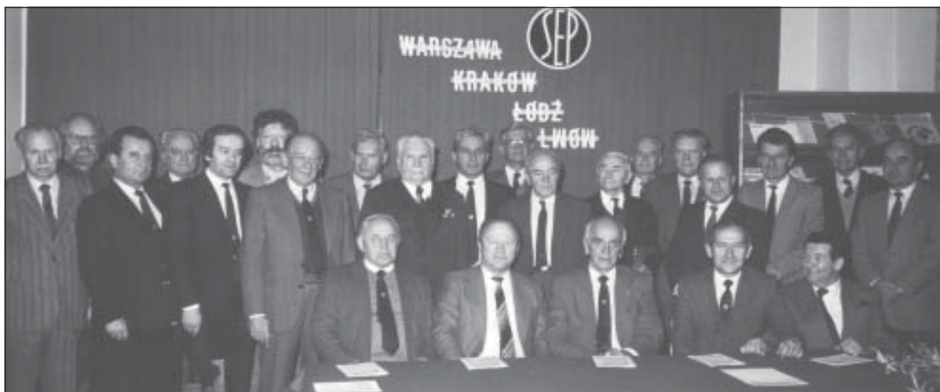
Uczestnicy okolicznościowego spotkania przedstawicieli Oddziałów - Współzałożycieli SEP w sali Klubowej Domu Technika NOT w Krakowie (29.11.1988 r.)

Począwszy od przełomu lat 1961/62 zaczęło działalność pięć Sekcji: Energetyczna, Telekomunikacyjna, Instalacji i Urządzeń Elektrycznych, Trakcji Elektrycznej oraz Techniki Jądrowej. Od 1964r. rozpoczęły działalność Sekcje Energetyki Przemysłowej oraz Elektroniki. Obok narad i odczy-