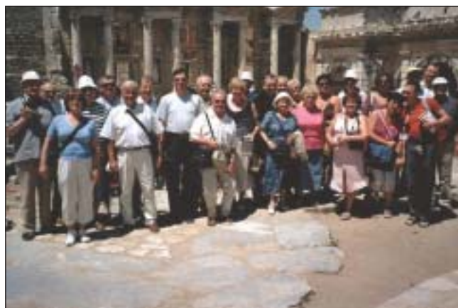
Grupa uczestników rewelacyjnej wycieczki techniczno-turystycznej O/Kr SEP do Turcji (11-25.05.2006r.)