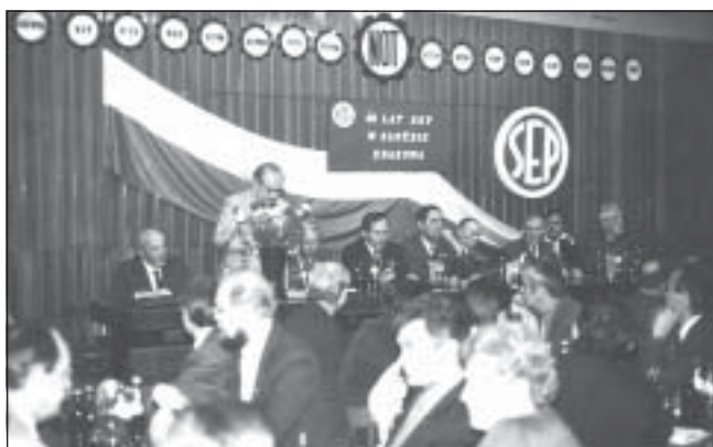
Uroczyste Spotkanie z okazji 65-lecia Oddziału Krakowskiego SEO w Domu Technika NOT w Krakowie (14.09.1984 r.)

W zjeździe założycielskim wzięło udział 17 elektryków krakowskich, którzy wygłosili 5 referatów