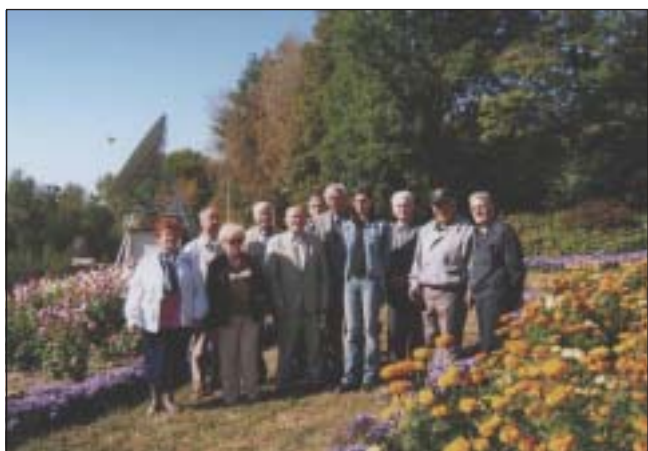
Grupa z Koła Seniorów nr 7 w trakcie zwiedzania Obserwatorium Astronomicznego UJ na Bielanych (02.10.2007r.)