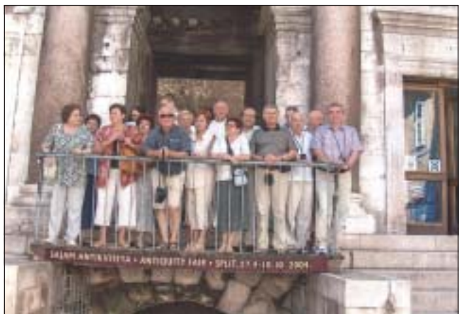
Grupa uczestników wycieczki techniczno-turystycznej O/Kr SEP do Chorwacji (25.09-03.10.2004r.)