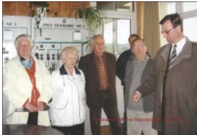
Grupa Uczestników Seminarium SliUE oraz Koła SEP nr 56 w Dobczycach (06.05.2005r.)