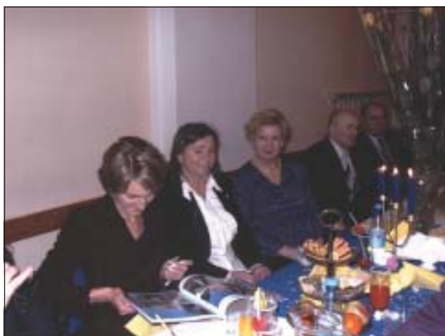
Uczestnicy Noworocznego Spotkania Aktywu z zainteresowaniem przeglądają Kronikę O/Kr SEP (23.01.2004r.)