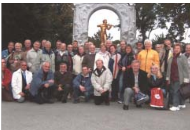
Uczestnicy wycieczki techniczno-turystycznej O/Kr SEP do Wiednia (17-19.09.2008r.)