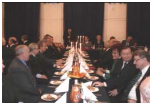
Tradycyjne Noworoczne Spotkanie Aktywu O/Kr SEP z Członkami Wspierającymi Oddziału w Domu Kultury Kolejarza (21.01.2006r.)