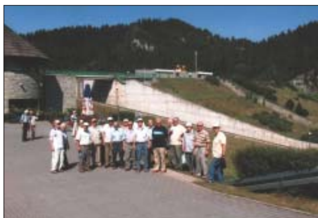
Wycieczka Koła Seniorów nr 7 do Zespołu Elektrowni Wodnych Czorsztyn - Niedzica (17.07.2007r.)