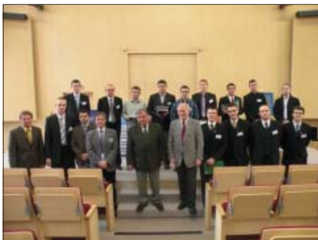
Laureaci, patroni, Komisja Konkursowa oraz organizatorzy Konkursu Wiedzy Elektrycznej 2009 (02.04.2009r.)