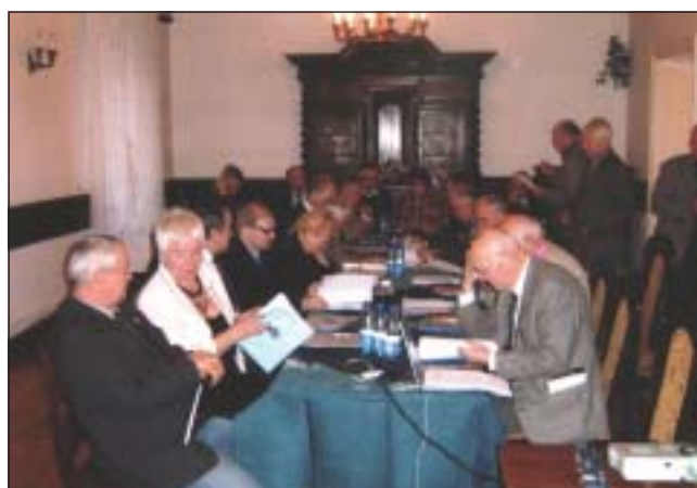
Uczestnicy dorocznego Seminarium wyjazdowego Komisji Kwalifikacyjnych O/Kr SEP w trakcie obrad seminarium z zainteresowaniem zapoznaje się z udostępnionymi materiałami (10-11.10.2008r.)