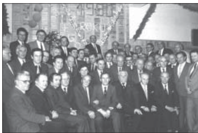
Uczestnicy Noworocznego Spotkania Aktywu O/Kr SEP z Członkami Wspierającymi SEP w Zembrzycach (20.01.1990 r.)

Kryzys gospodarczy i społeczno-polityczny z początku lat osiemdziesiątych spowodował pewien regres działalności Oddziału. Zmniejszyło się zainteresowanie członków pracami Sekcji i Kół. O około 20% zmniejszyła się w latach 1980-1983 liczba członków indywidualnych, rozwiązaniu uległo kilka kół zakładowych. Najpilniejszym zadaniem Zarządu Oddziału było przeciwdziałanie tym ujemnym tendencjom i stopniowe przywracanie