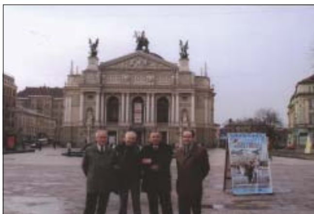
Członkowie delegacji Oddziału Krakowskiego SEP w trakcie spaceru po Lwowie przed budynkiem teatru (05-07.04.2004r.)