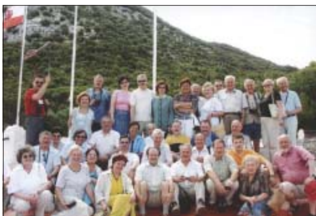
Grupa Uczestników wycieczki techniczno-turystycznej O/Kr SEP do Hiszpanii i Portugalii (19-29.05.2005r.)