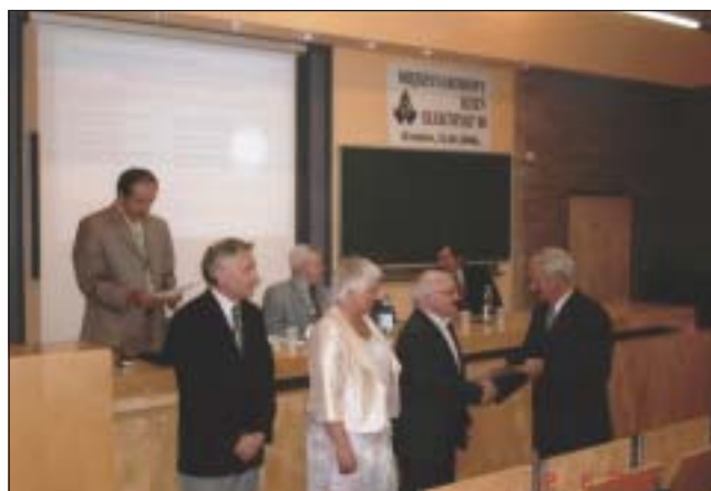
Ceremonia wręczenia odznaczeń stowarzyszeniowych w trakcie Uroczystego Spotkania z okazji Międzynarodowego Dnia Elektryki '2008 w Katedrze Telekomunikacji AGH (12.06.2008r.)