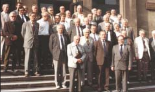
Uczestnicy Spotkania z okazji Dnia Elektryka 1992 przed budynkiem Wydziału Elektrotechniki, Automatyki i Elektroniki (10.06.1992r.)

Począwszy od 1984r. następuje ponowne stopniowe ożywienie działalności Oddziału. Przełamało praktycznie kryzys z początku lat osiemdziesiątych. Oddział zaczął odnotowywać systematyczny, choć niewielki przyrost liczby członków indywidualnych, który miał miejsce do 1988r. Na koniec 1988r. zarejestrowanych było w Oddziale 2937 członków indywidualnych skupionych w 84 kołach oraz 54 członków zbiorowych.