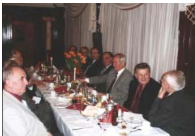
Tradycyjne doroczne spotkania Prezydów O/Kr SEP i O/NH SEP w Restauracji Sinus w Krakowie (22.11.2005r.)