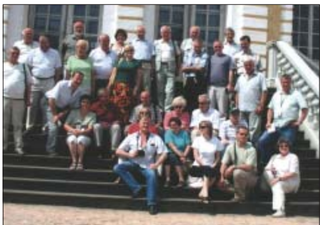
Uczestnicy wycieczki O/Kr SEP do krajów nadbałtyckich (25.05.- 03.06.2007r.)