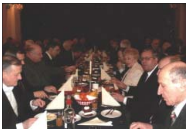
Uczestnicy Noworocznego Spotkania Aktywu z apetytem delektują się poczęstunkiem w Domu Kultury Kolejarza (18.01.2008r.)