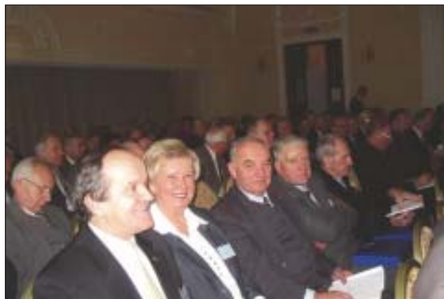
Grupa Delegatów O/Kr SEP w Domu Technika NOT w Warszawie w trakcie obrad XXXII NWZD SEP (21.06.2004r.)