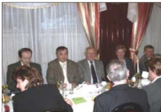
Część Uczestników dorocznego Spotkania prezydentów O/Kr SEP i O/ZW SEP w Restauracji Sinus w Domu Technika NOT (07.03.2006r.)