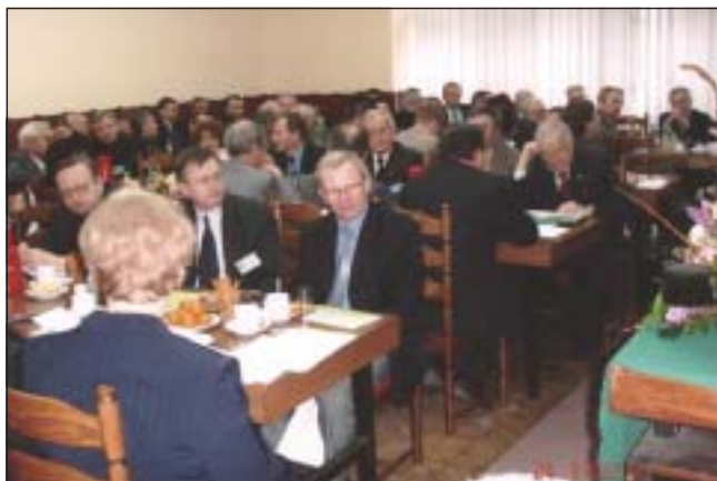
Uczestnicy Walnego Zgromadzenia Delegatów Oddziału Krakowskiego SEP w trakcie obrad Zgromadzenia (24.03.2006r.)