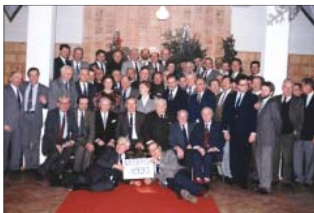
Zdjęcie pamiątkowe uczestników Noworocznego Spotkania Aktywu O/Kr SEP z członkami wspierającymi SEP w Zembrzycach (20.01.1993r.)

Należy odnotować, że w całym pięcioleciu Oddział utrzymywał pozytywny wynik finansowy.