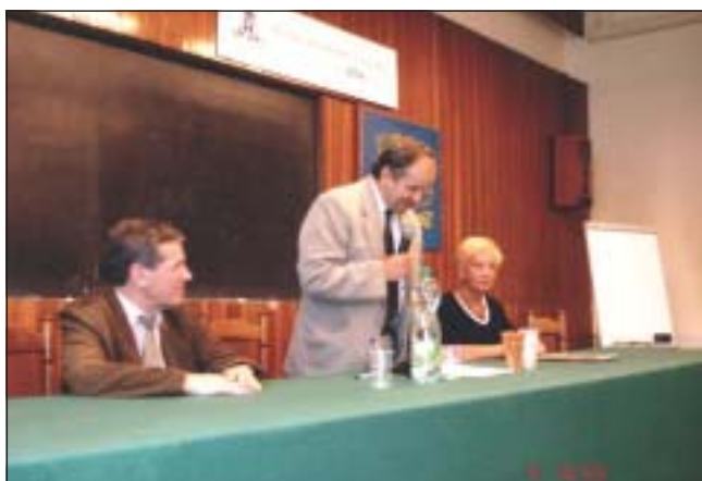
Podsumowanie kolejnej edycji Konkursu Komputerowego w O/Kr SEP w Domu Technika NOT (05.06.2008r.)