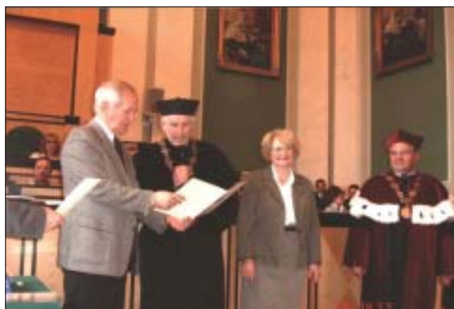
Uroczyste podsumowanie Konkursu Na Najlepszą Pracę Dyplomową w Auli AGH (24.03.2007r.)