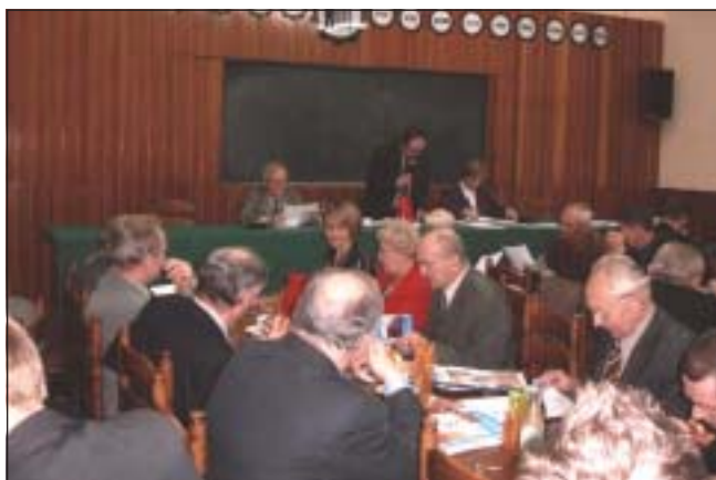
Plenarne doroczne Zebranie Sprawozdawcze Zarządu Oddziału Krakowskiego SEP (22.02.2006r.)